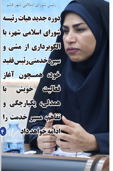
رئیس شورای اسلامی شهر قشم:

دوره جدید هیات رئیسه شورای اسلامی شهر، با الگوبرداری از مشی و سیره خدمتی رئیس فقید خود همچون آغاز فعالیت خویش با همدلی، یکپارچگی و تفاهم، مسیر خدمت را ادامه خواهد داد