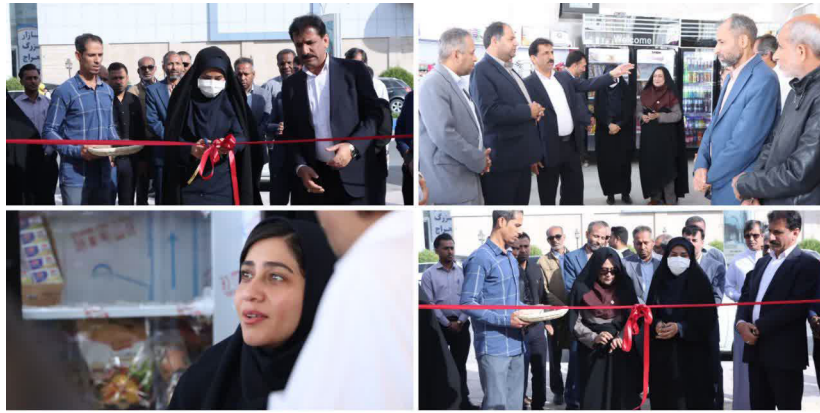
شهرداری نسبت به احیای آن اقدام و امروز شاهد آن هستیم که منفعت این مجموعه به

تمامی شهروندان می‌رسد. شهردار قشم تصریح کرد: طرح توسعه تعاونی نیز در دستورکار قرار دارد تا بتوان سبب خرید شهروندان را به طور کامل تامین کرد.