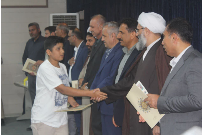
اشاره به اهمیت دعا برای بچهها گفت

اگر بخواهیم این شور و اشتیاق به درس را در بچهها ایجاد کنیم و در تربیت نیک آنان مؤثر باشیم راهش دعا و راز و نیاز به درگاه خداوند متعال است. امام جمعه قشم در ادامه گفت رفتار و عمل ما در خانواده، رابطه مستقیم با تربیت بچهها دارد. ایشان افزود: محیطهای آموزشی محل علم و دانش و فرهیختگی و رشد و بالندگی است.