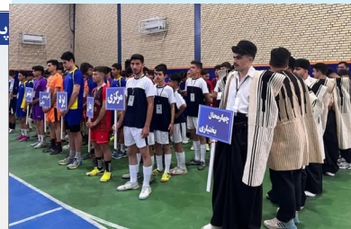
قشم - خبرنگار کاوان:

مسابقات بومی و محلی هفت سنگ ویژه آقایان رده سنی زیر ۱۸ سال کشور، از روز ۱۷ اردیبهشت ۱۴۰۴ به میزبانی شهرستان قشم آغاز شد.