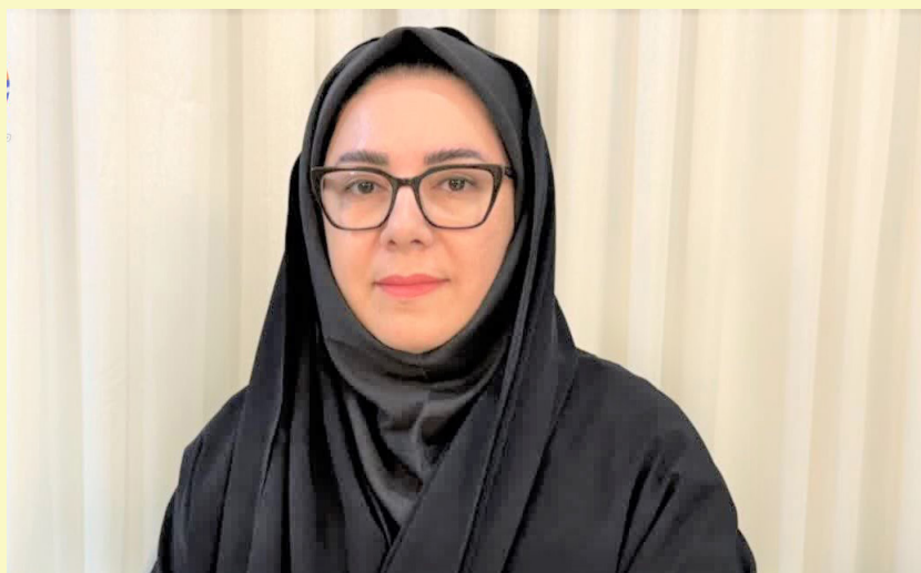
فرهنگی و اجتماعی، آسیب‌شناسی و احصاء نیازهای جامعه بانوان و دختران،