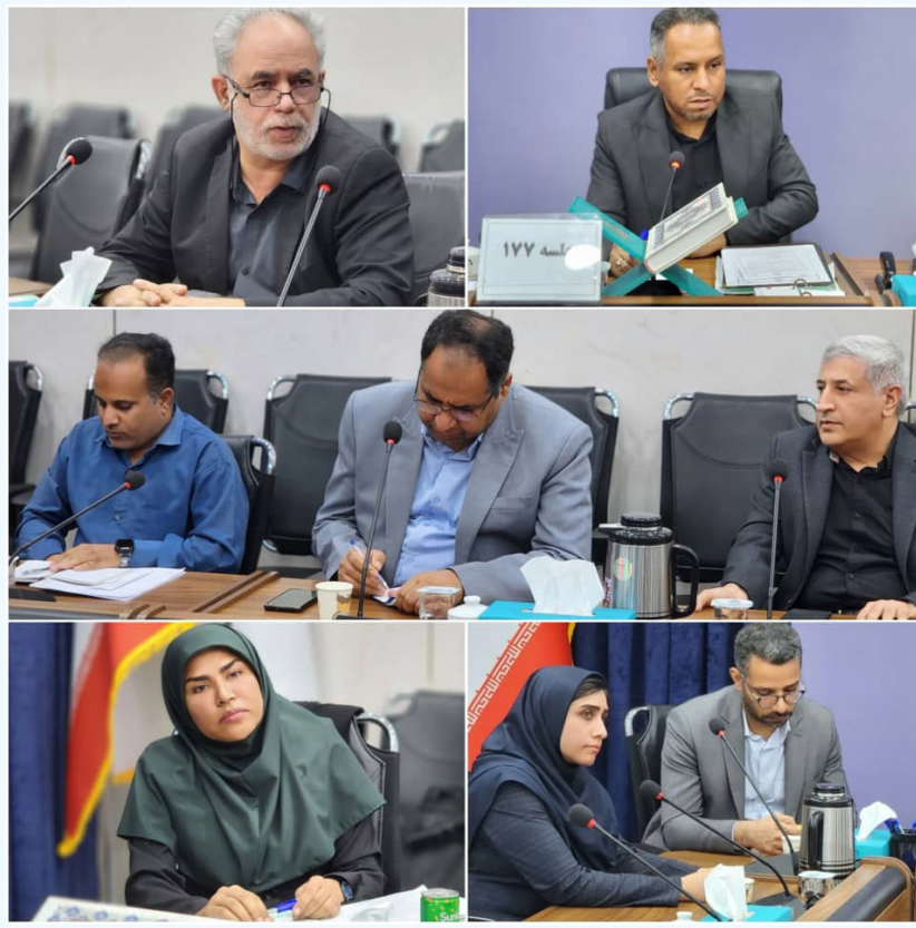
رئیس اداره محیط زیست قشم نیز از آمادگی اداره محیط زیست برای