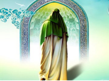
امام زمان (عج) می‌فرماید:

إِنَّهُ لَيْسَ يَبْنِي اللَّهُ عَزَّ وَجَلَّ وَبَيْنَ أَحَدٍ قَرَابَةً، وَ مَنْ أَتَى قَلْبِي مَتَى، وَ سَبَّيْلَهُ سَبَّيْلَ أَبِي نُوحٍ.